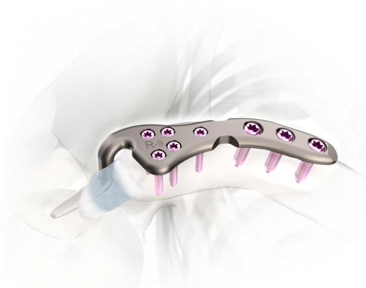
可變角度鎖定骨板