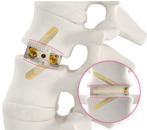
創傷、骨折、脊椎治療